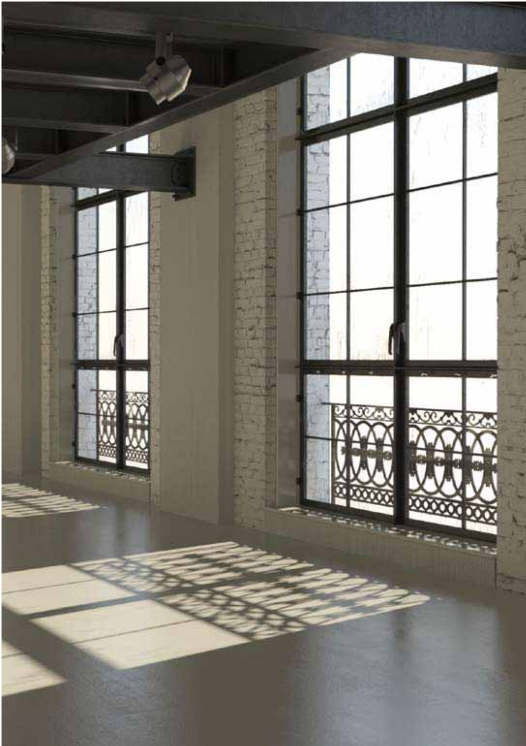
Suelo revestido con microcemento color Sáhara, acabado mate.