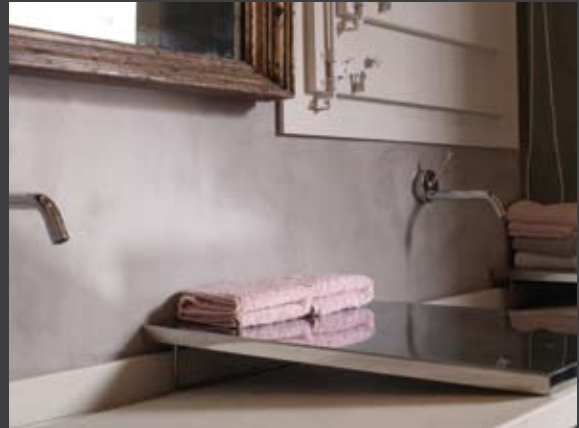
Pared revestida con microcemento color Sáhara, acabado mate.

Floor covered with microcemento Sand color, matte finish.