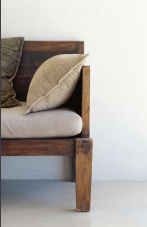
Suelo revestido con microcemento color Arena, acabado mate.

Floor covered with microcemento Sand color, matte finish.